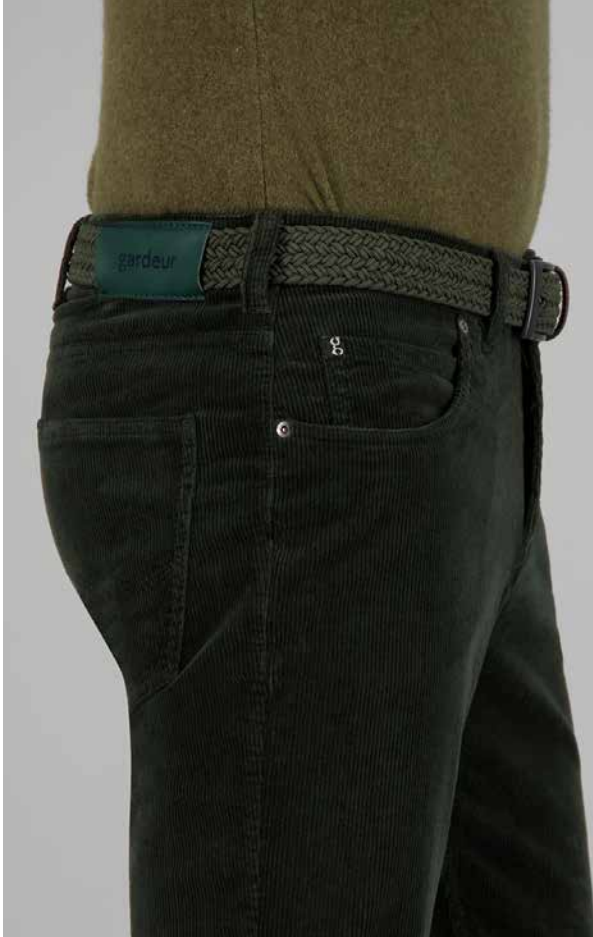
BILL-3, ART. 60441 COL. 1078