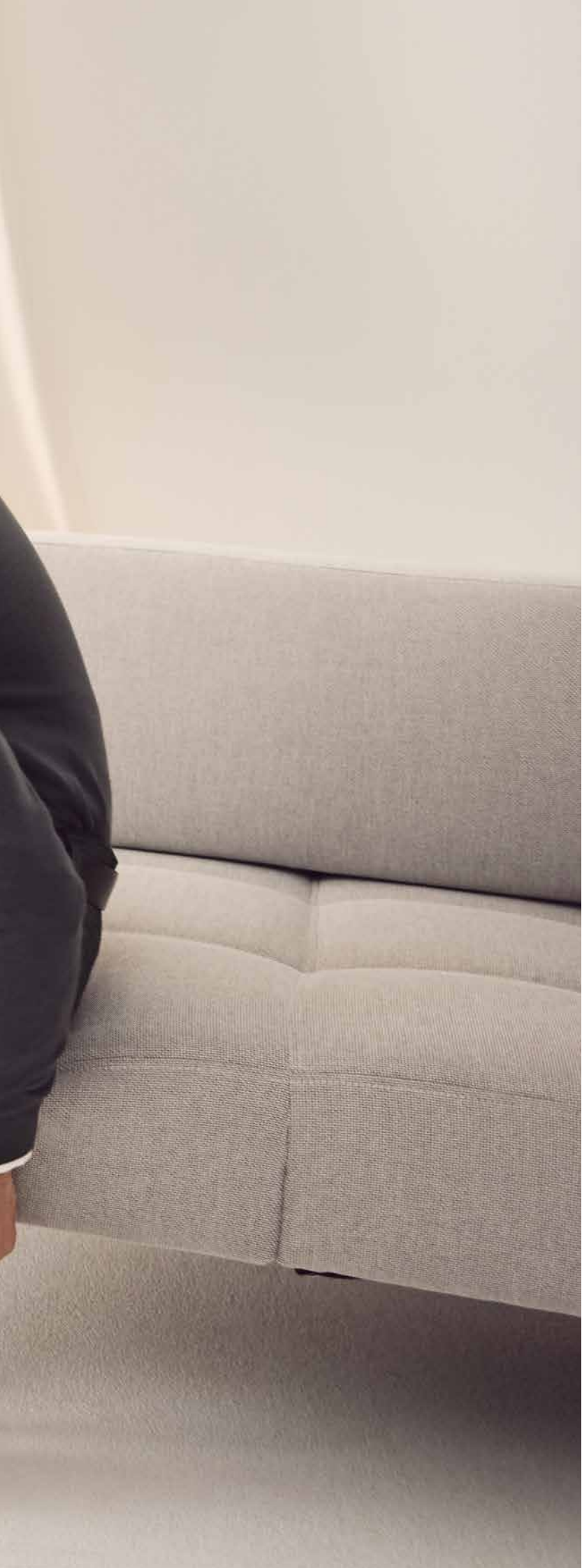
BILL-3, ART. 41531 COL. 1098