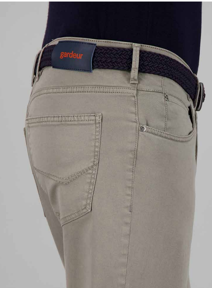
BRADLEY, ART. 60621 COL. 3071