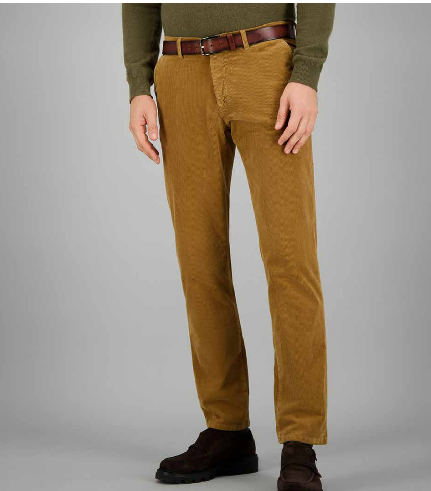
BONO, ART. 60441 COL. 2018, BELT: ART. 380048 COL. 025