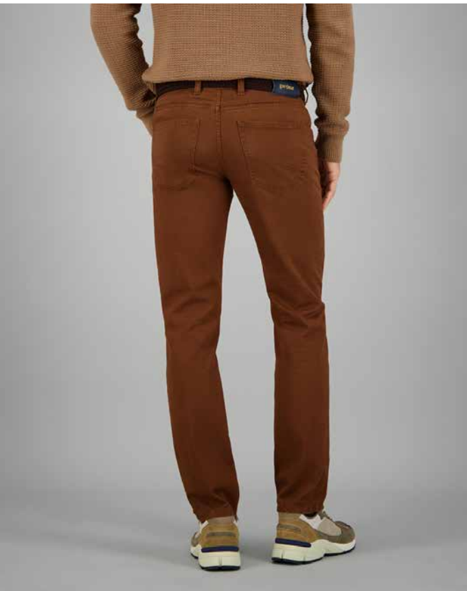
BILL-3, ART. 418861 COL. 1028