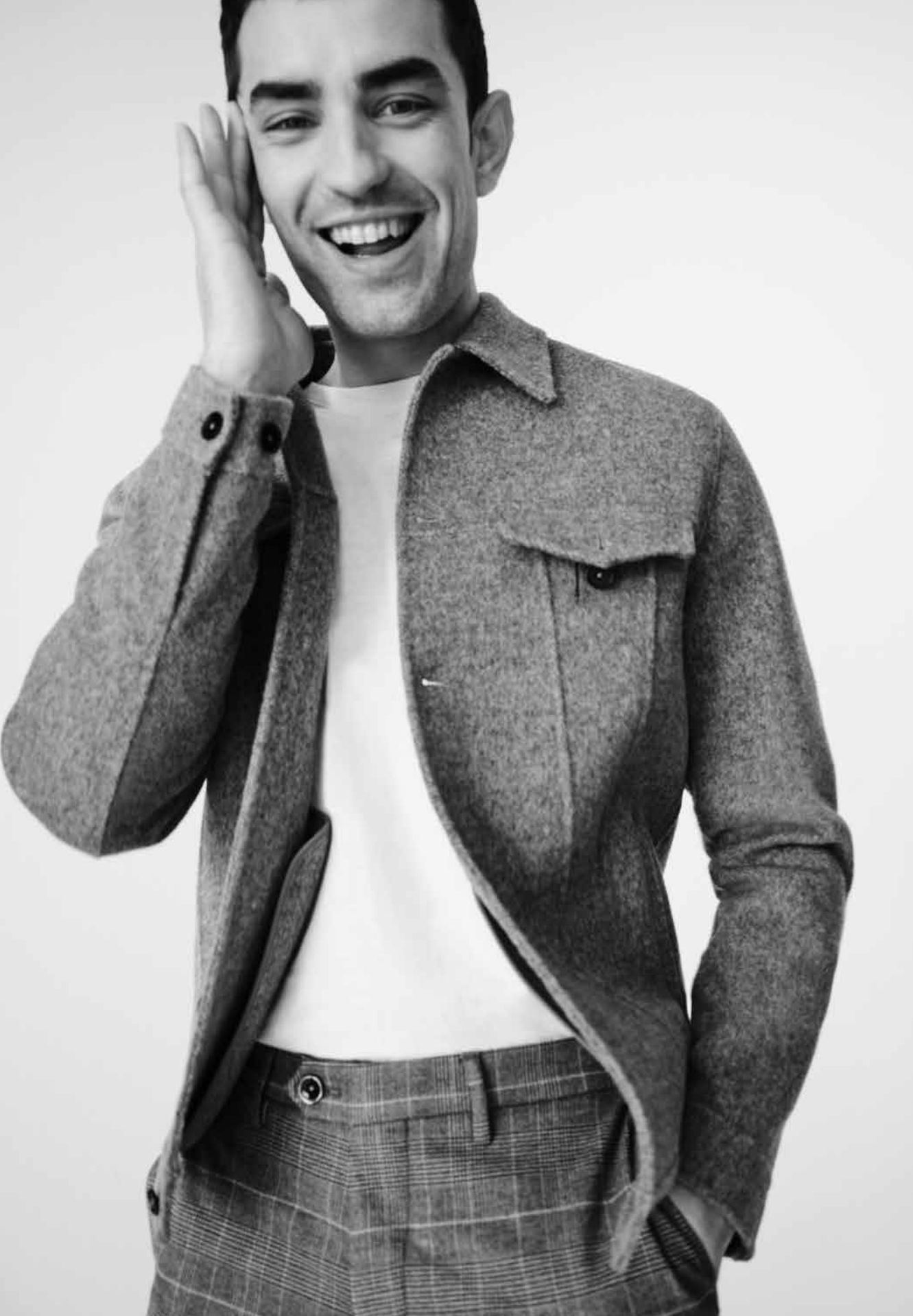
SAVAGE-3, ART. 420771 COL. 1093