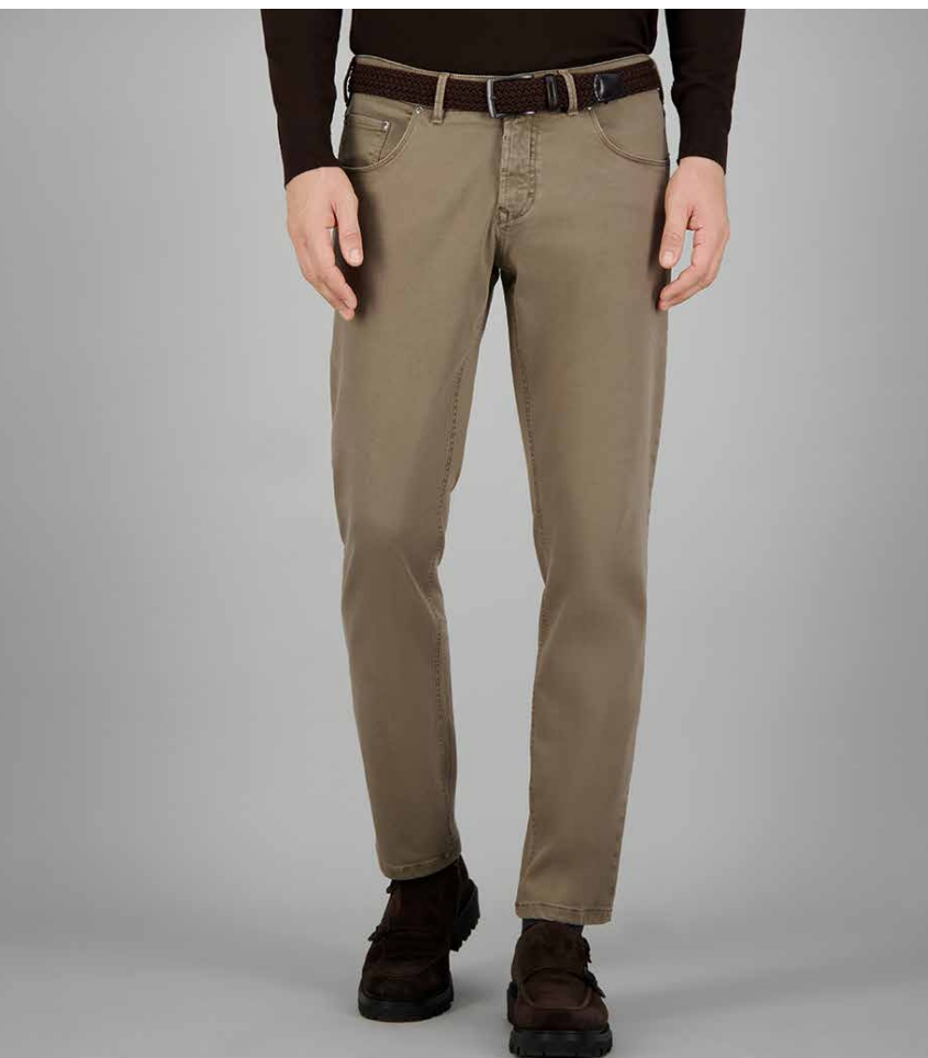
SANDRO-1, ART. 60621 COL. 1029