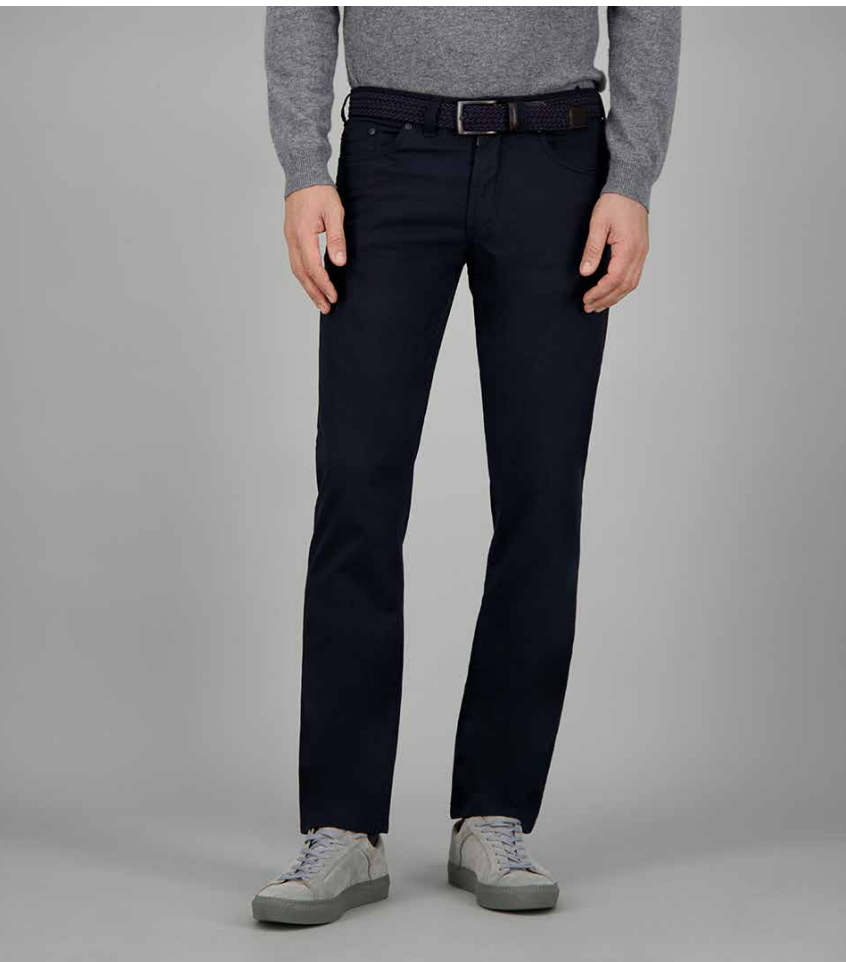
NEVIO-11, ART. 418861 COL. 1069