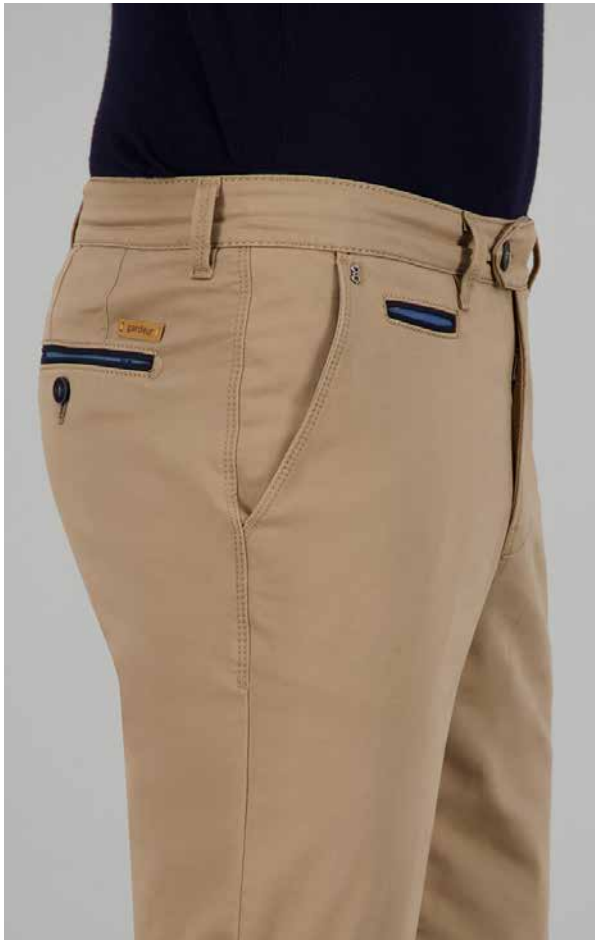
BENNY-3, ART. 418861 COL. 1017