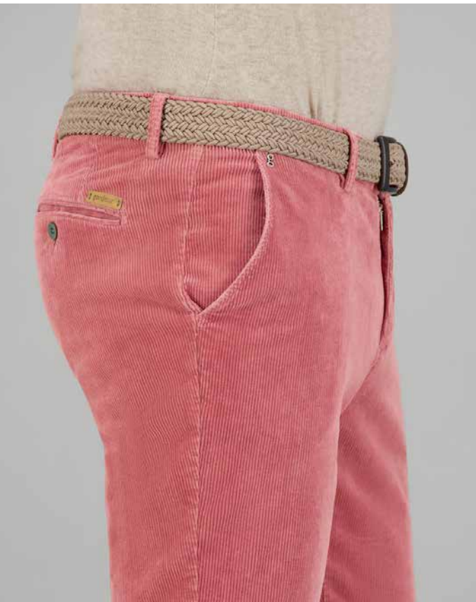
SAVAGE-2, ART. 60441 COL. 1016