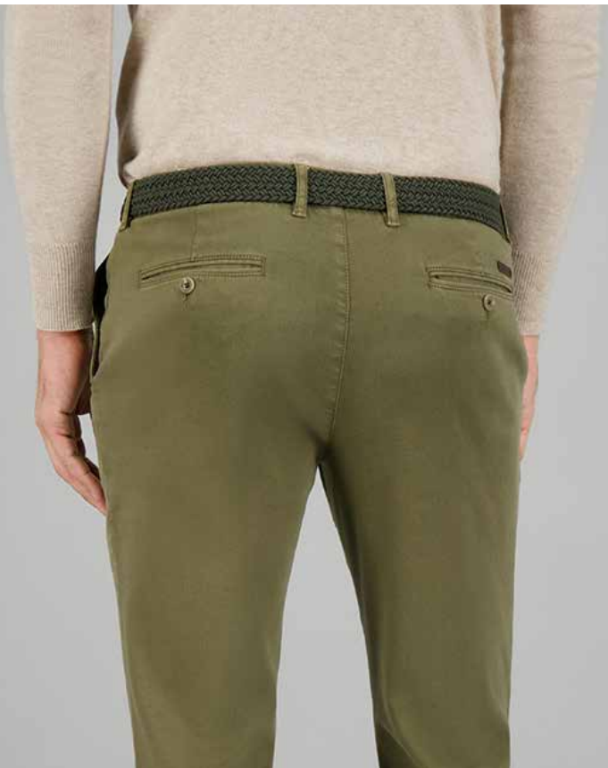
SANTOS, ART. 60621 COL. 1075