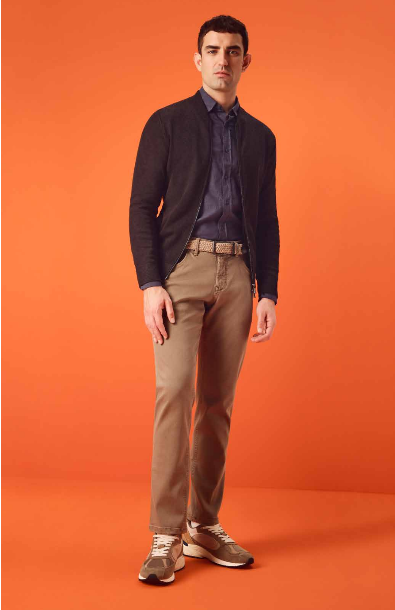
BRADLEY, ART. 60621 COL. 1029