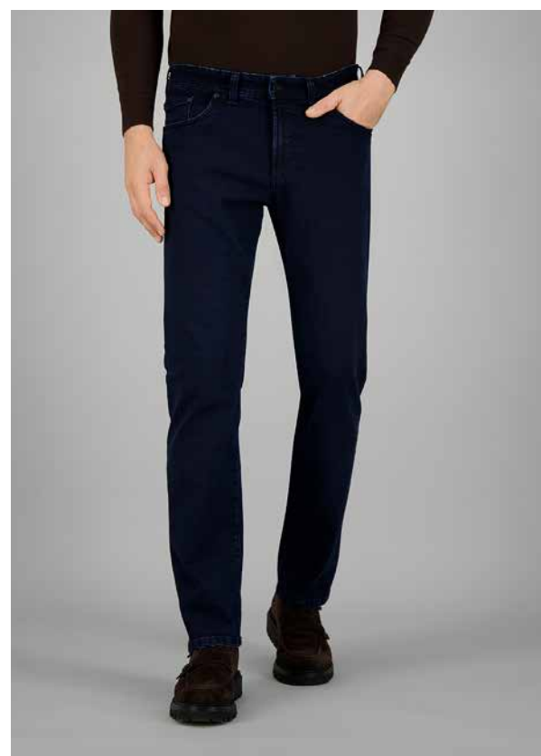
NEVIO-1, ART. 470991 COL. 9269