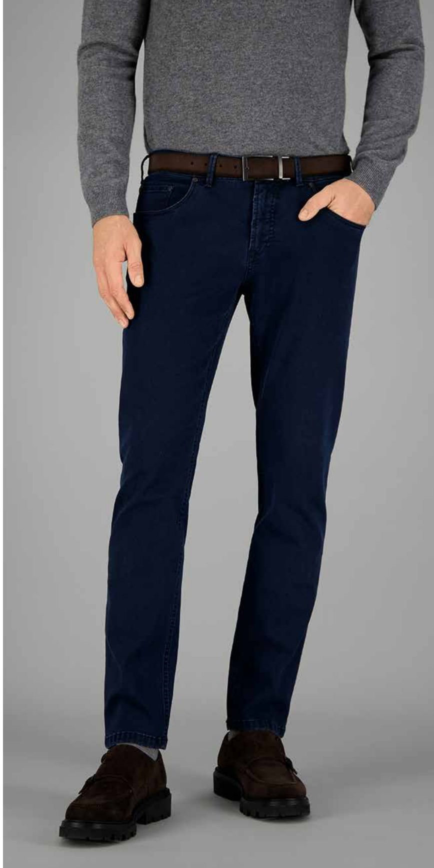
SANDRO-1, ART. 470991 COL. 9269