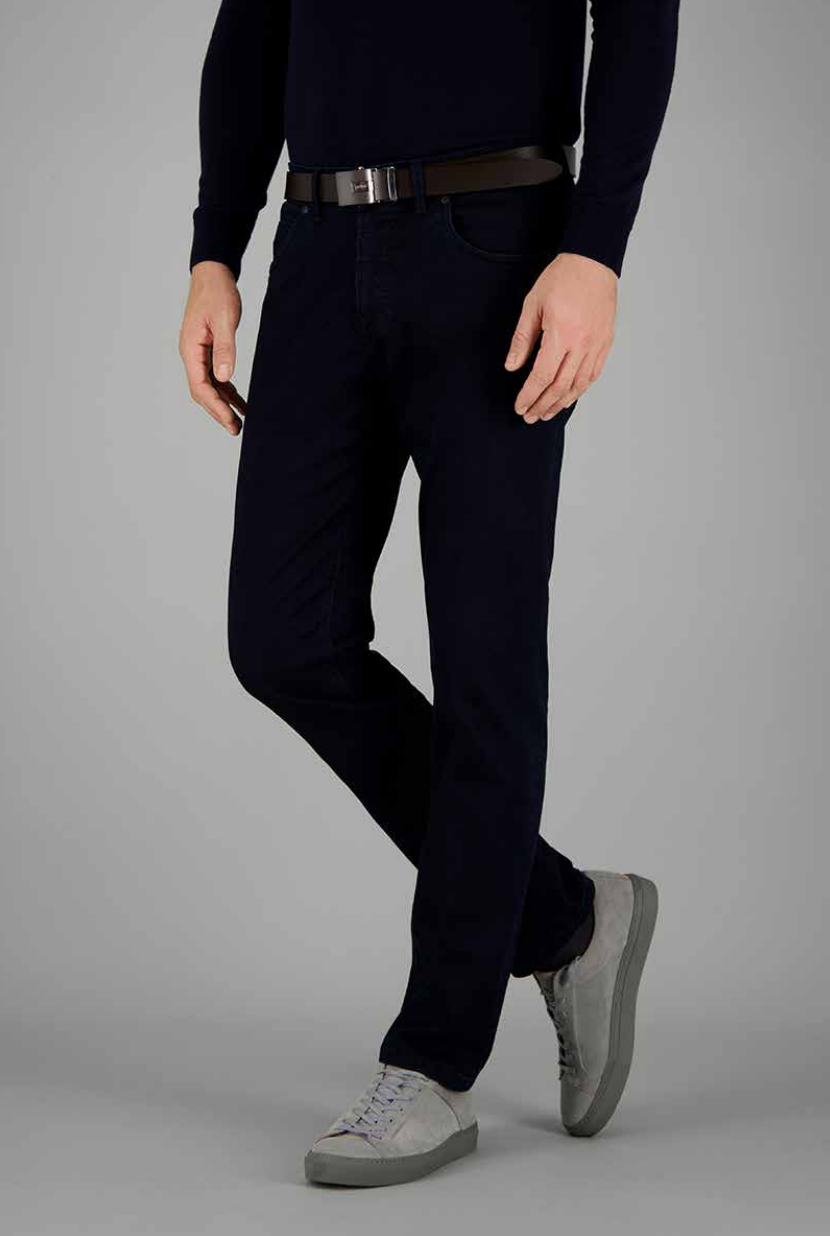
BRADLEY, ART. 470991 COL. 8269, BELT: ART. 49665 COL. 028